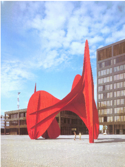
A. Calder: La gran velocidad

La escultura del S. XX plantea una ruptura que va más allá de lo puramente formal, ya que tiene una base conceptual que le hace rechazar y renovar conceptos, formas y materiales, que implica un rechazo de la mimesis para dar paso a obras no figurativas, a la abstracción, a la idea, y al concepto...Una revisión de la escultura permite señalar en la primera mitad de siglo la existencia de dos grandes tendencias (figurativa y abstracta) que tienen su punto de partida en la producción de artistas del siglo XIX: A. Rodin (escultor) y de Paul Cézanne (pintor), Paul Gauguin (pintor y escultor)...y en los movimientos del primer tercio del S. XX conocidos como “Ismos” (Cubismo, Futurismo, Dadaísmo...). La segunda mitad del siglo aporta la reflexión sobre lo sucedido en las décadas anteriores, uniéndose a ello la aparición de nuevos movimientos como el Pop Art, los artistas del Nuevo Realismo y el Hiperrealismo (figurativos), el Cinetismo y el Minimal (abstractos), etc.