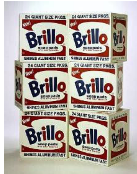
A. Warhol: Cajas apiladas