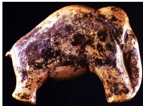
Mamut de Vogelherdhöhle